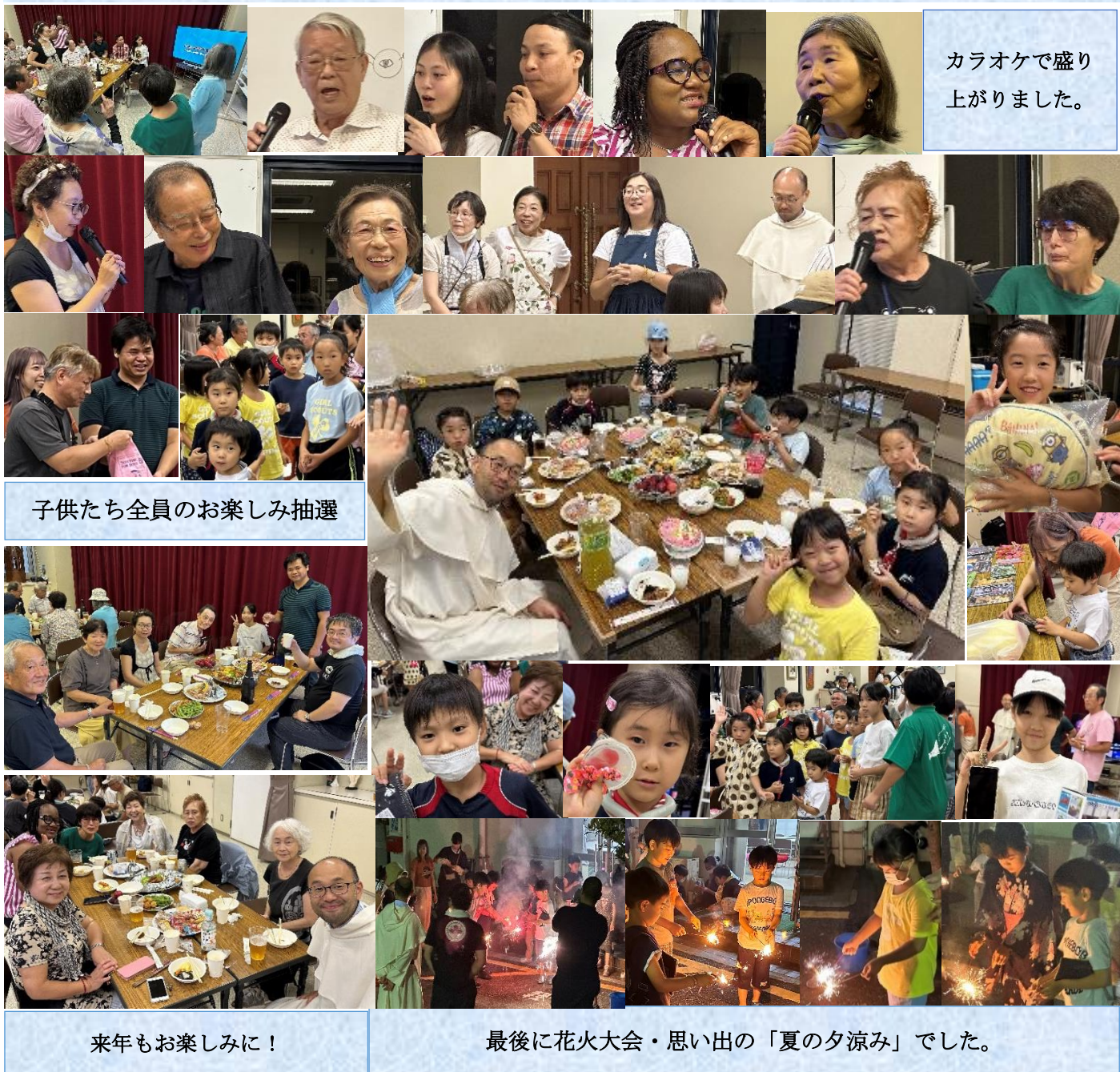
カラオケで盛り 上がりました。