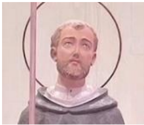
守護聖人ドミニコ